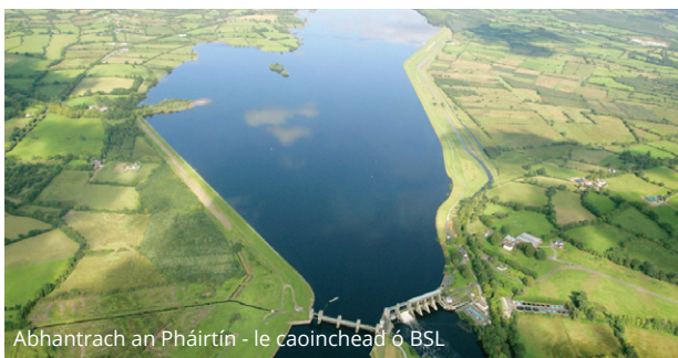
Abhantrach an Pháirtín - le caoinchead ó BSL

Le sainaithint a dhéanamh ar Fhoinse Nua do Réigiún an Oirthir agus an Láir Tíre, tá an-chuid taighde, measúnachtaí timpeallachta agus teicniúla ar roghanna éagsúla agus trí chomhairliúchán pobail déanta ag Uisce Éireann le roinnt blianta anuas.